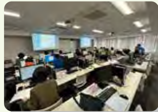
専門学校での実習