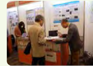
ESRIコミュニティフォーラム

一方、一般向けのイベントとして、市民を対象とした観察会・学習会に協力し、身近な自然を知ることによる生物とその生息空間、生態系への意識の醸成を目指しています。