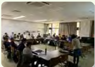
地域自然情報研究会

また、地生態学をより多くの方に知っていただくため、座学と現地見学会を組み合わせたセミナーとツアーも企画・実施しています。