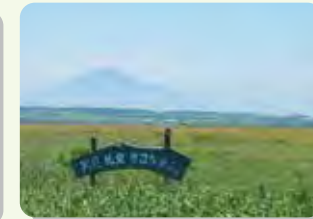
サロベツ自然再生協議会