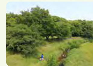
水辺・緑地の保護保全への貢献

「30by30」の取組に関心をお持ちで、達成に貢献したいとお考えの皆様は、是非、GCNIにご相談ください。